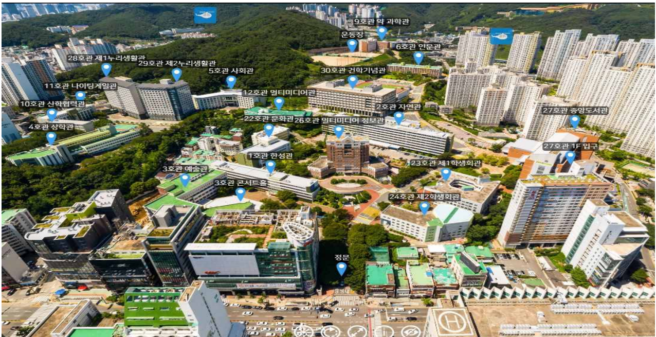
Kyungsung University Campus View

Kyungsung University is located in Busan, the second-largest city and the primary port city of South Korea. Busan is an internationally recognized cultural and tourist city where various global events and festivals such as the Busan International Film Festival, G-STAR (Game show & Trade, All-Round), Busan International Marketing & Advertising Festival(MAD STARS) and Busan Fireworks Festival take place. Also, there are five beaches including Haeundae Beach and Gwangalli Beach, which are the most famous beaches in South Korea. Kyungsung University features a downtown campus that is safe and conveniently accessible with a subway station and bus stops near the entrance of University. Additionally, the campus is surrounded by government offices, large supermarkets, and numerous commercial facilities, providing residents with a convenient and comfortable lifestyle.