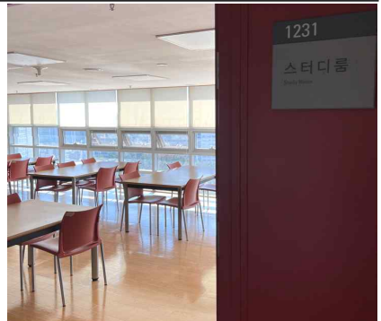
기숙사 내부 생활환경