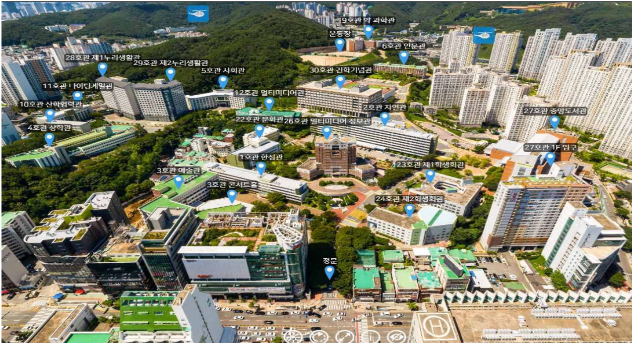
경성대학교 캠퍼스 전경

경성대학교는 대한민국의 두 번째 도시이자 제1의 항구도시인 부산에 위치하고 있습니다. 부산은 부산국제영화제, 국제게임전시회 G-STAR, 부산국제마케팅광고제, 부산불꽃축제 등 세계적으로 유명한 각종 이벤트와 축제가 열리는 국제적인 문화관광도시이며, 대한민국을 대표하는 해운대와 광안리를 포함하여 5개의 해수욕장 있습니다. 경성대학교는 부산의 중심가에 위치하며, 도심형 캠퍼스로서 안전하고 편리하며, 학교 입구에 지하철역과 버스 정류소가 있어 접근성이 매우 높습니다. 또한 캠퍼스 근처에는 관공서, 대형마트 및 많은 상업시설이 있어 생활이 편리합니다.