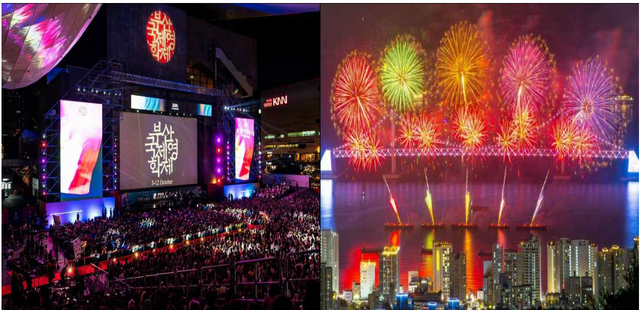
부산의 다양한 이벤트와 축제